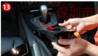
13. Entfernen Sie den Wasserbecherhalter an der Windschutzscheibe des Originalfahrzeugs.