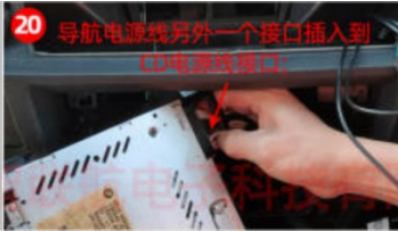
20. Stromkabel des CD-Players auf das Navigationsstromkabel übertragen