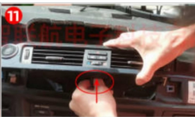
11. Entfernen Sie den Kabelbaum der Klimaanlage. (Hinweis: Einige Kabelbäume haben Clips, ziehen Sie nicht zu stark daran).