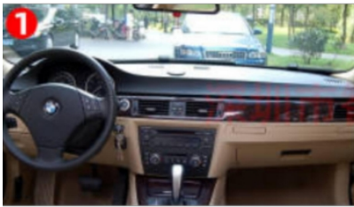
1. Zentrales Steuerungsdiagramm des Originals Fahrzeug