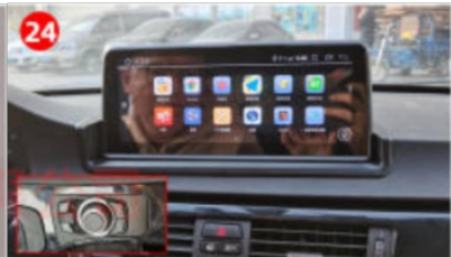
24. Installieren Sie den Navigationsbildschirm und