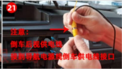
21. Stromversorgungskabel für Rückfahrkamera