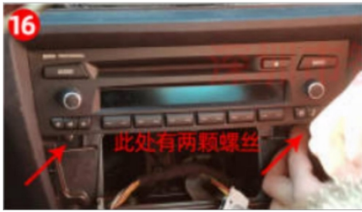
16. Entfernen Sie die Original-CD des Fahrzeugs.