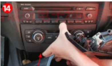
14. Entfernen Sie die Klimaanlage. 15. Entfernen Sie den Kabelbaum der Klimaanlage.