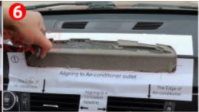
6. AbreißenabdiezweiteSchichtdesSchwammes mit roter Linie