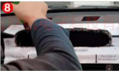
8. Verwenden Sie ein Universalmesser, um den Radius der Kante anzupassen, bis die Basis des Navigationsbildschirms nach dem Aufsetzen flach ist