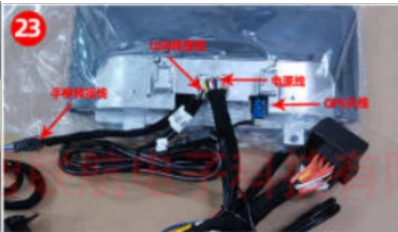
23. Verbinden Sie den Kabelbaum hinter dem