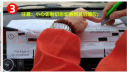
3. Nach dem Einfügen der Zeichnung verlängern Sie den roten Rand der Zeichnung und schneiden Sie die erste Lederschicht mit einem Universalmesser