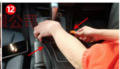
12. Entfernen Sie die Schalthebelposition. Blende des Originalfahrzeugs mit der Unterfahrschutzplatte