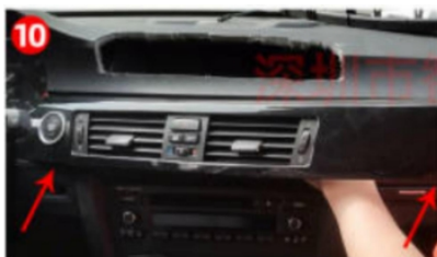
10. Hebeln Sie die A/C-Luftauslassblende heraus