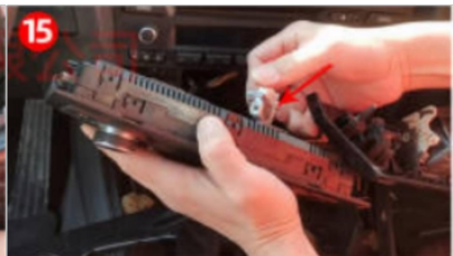
15. Entfernen Sie den Kabelbaum der Klimaanlage.