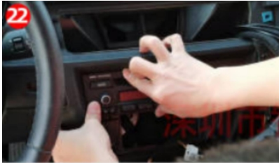
22. Installieren Sie den Original-CD-Player und NavigationssystemBildschirmentsprechendgemäßdem