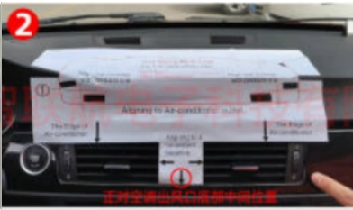
2. Fügen Sie die Zeichnung in die Mitte ein Steuerposition entsprechend der Anforderungen, die in der Zeichnung angegeben sind, mit einem Universalmesser