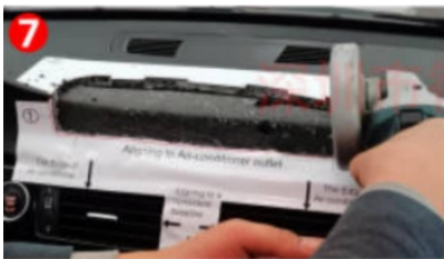
Die dritte Schicht der Platte wird innerhalb der roten Linie des Handmühlen- Verlängerungsaufklebers ausgeschnitten