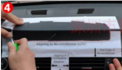
4. Die roten Linienzeichnungen abreißen nach dem Schneiden