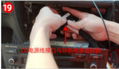
19. Das Netzkabel des CD-Players wurde zum Navigations-Netzkabel verlegt