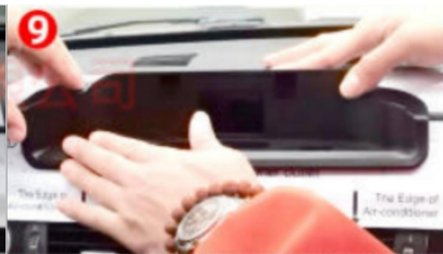
9. Setzen Sie die Basis des Navigationsbildschirms in die ausgeschnittene zentrale Steuerposition ein. Wenn keine weiteren Probleme auftreten, entfernen Sie einfach den Aufkleber