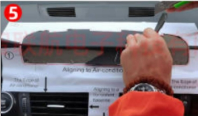
5. Ziehen Sie die erste Lederschicht ab Oberfläche der Platte mit dem roten Linie des Verlängerungsaufklebers